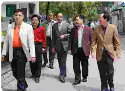
中国工程院党组书记、院长、原武汉大学校长 李晓红来学院视察、指导工作