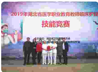
湖北省医学职业教育教师临床护理技能竞赛团体二等奖