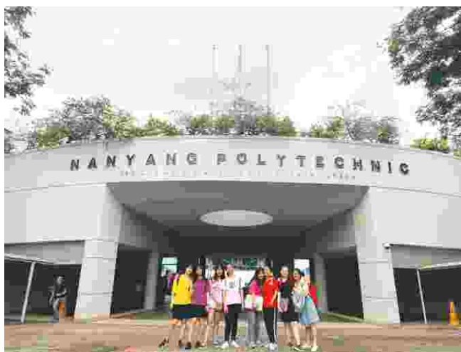
我院赴新加坡南洋理工学院留学生

与新加坡学术交流是学院国际合作交流的特色和优势，通过选派学生前往新加坡南洋理工学院和义安理工学院公费留学学习、遴选师资交流培训、引进高水平课程体系和教育模式，结合学院实际和学科优势，不断优化教学思路 and 教学模式。