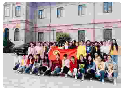
团校培训素质拓展