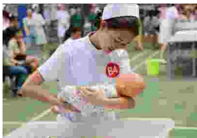
护理专业老师对学生进行实训指导

(1) 培养目标： 培养适应医药卫生事业发展需要，具备医学、预防保健、人文社会科学基础知识及护理学基本理论知识和技能，能在护理领域从事临床护理、预防保健、护理管理等工作的高层次实用型护理人才。