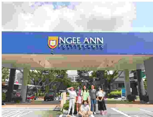
我院赴新加坡义安理工学院留学生

学院在“优势互补、共同发展”基础上与台湾辅英科技大学开展交流，双方每年互派6名学生赴对方学校进行一学期的学习交流、互派教师到对方学校授课和讲学、双方开展学科领域科研合作等。