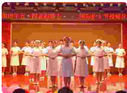
五·一二国际护士节授帽仪式