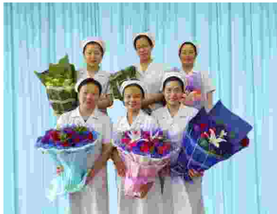
护理专业骨干教师团队

学院开办了武汉科技大学护理本科自学考试助学班，为学生职业生涯规划 and 未来发展奠定坚实的基础。