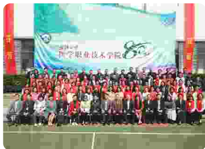
办学八十周年学术研讨会合影