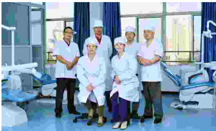
口腔专业骨干教师团队

该专业创办于1986年，以多年专业建设作基石，以市场需求为导向，培养了大批掌握基础医学理论知识和口腔临床医学实操技能的具有良好职业道德素养和人际沟通能力的实用型人才。毕业生操作水平高，适应能力强，具有独立的工作能力，适应社会多层面对于口腔医疗、口腔美容的需求。就业形式灵活，就业市场广阔，毕业生遍及全国各地，涌现出很多成功的自主创业者，就业率达95%以上。该专业实训设备先进，“双师型”教学团队实力强大，经省教育厅、省卫健委专业设置评估认定为优秀专业。