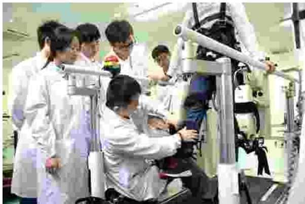
康复治疗技术专业学生指导病人进行功能恢复训练

(3) 毕业去向 ：学生毕业后，可在各级综合医院、康复机构、运动队、社区、家庭从事康复治疗与康复保健工作或自主创业。择业灵活，去向多元，就业前景好。