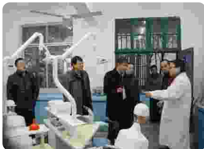
武汉大学党委书记韩进 来学院视察、指导工作