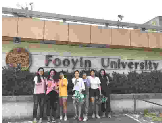
赴台交流师生校园留影