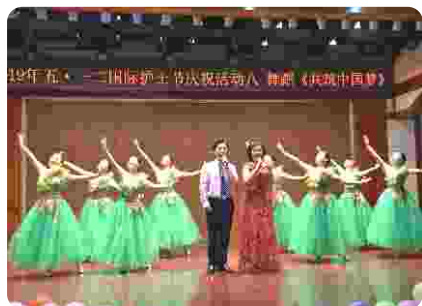
师生联欢同庆五·一二国际护士节