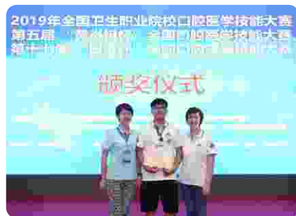
全国职业院校口腔技能大赛个人三等奖